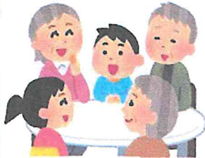
保見ヶ丘六区 にこにこクラブ