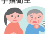
基礎疾患がある人や妊婦は人混みを避ける