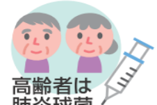
高齢者は肺炎球菌ワクチンの接種