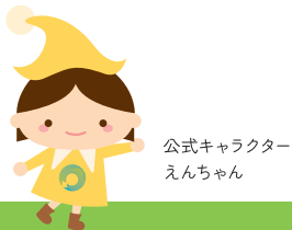
公式キャラクター えんちゃん