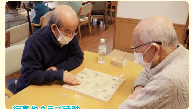
行事やクラブ活動